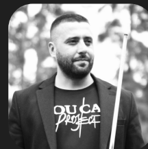
Тимур Бильярдная школа