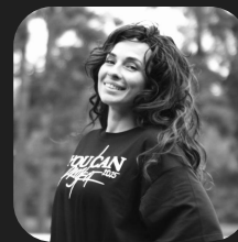
Виктория Тренер Врач ЛФК